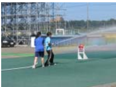
放水は思ったより水の勢いがすごくて、決められた姿勢でないと、ホースがぶれてしまうそうです。