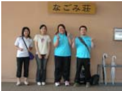
ボランティア活動をさせていただいた「特別養護老人ホームなごみ荘」の前で