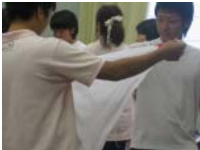
試験の様子。しっかり練習したから(?)緊張はしていないようです。