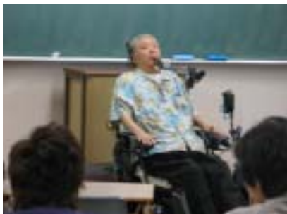
車いす生活になってから遭われた交通事故「坂ながし」のお話は衝撃的でした