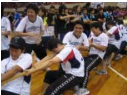
健康福祉科3年生は最後のスポーツデイ綱引きの準優勝は大きな思い出です

6月29日に横浜文化体育館でカレッジグループ5校合同のスポーツデイが行われました。当日の運営はスポーツデイ委員会を中心に行われ、風船運びリレー、綱引き、大縄跳び、リレーの4種目を5校24チームで競いました。YMCA健康福祉専門学校からはクラスごと8チームがエントリーし、スポーツを通して交流を深める一日となりました。綱引きでは、自分たちのクラスだけでなく、自分たちの学校のチームが出場している周りで、みな一丸となって大きな声で応援してくれました。結果、健康福祉科1年生が優勝、健康福祉科3年生が準優勝、介護福祉科2年生