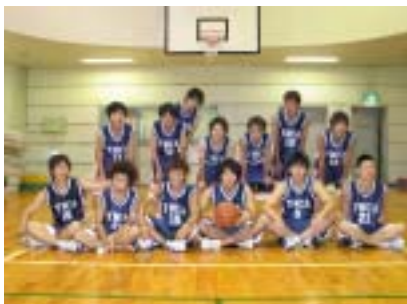
夏の専門学校体育大会へ向けて練習します！