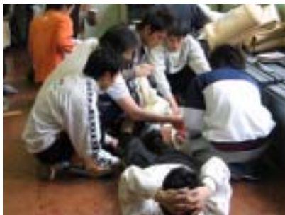
けがをした右足に負担をかけないように運搬するには…