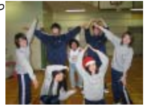
福スポの新1年生 チームワークも抜群!?

また、福祉スポーツ科ではたくさんの現場を生かした演習(授業)を取り入れるため、指導者としての心構えや子どもの理解、障がい者の理解に時間をかけていきます。もちろん2年生や専攻科の先輩たちがしっかりサポート。リーダー活動の第1歩はもう始まっています。