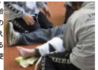
骨折!「痛いよー、助けて!」と けが人役も迫真の演技

な状況への正しい対処を学習していきます。悪戦苦闘しながら、4日間のハードスケジュールと検定試験を無事に終えることができました。子どもや高齢者、障がい者の現場で働くうえで、いのちを守ることは最も重い使命です。