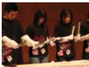
在校生による歓迎 トーンチャイム演奏

4月5日(木)、横浜YMCAカレッジ・グループの合同入学式を、県立音楽堂で行いました。入学式では毎年、各校在校生による歓迎のパフォーマンスが行われます。YMCA健康福祉専門学校からは、介護福祉科2年生によるトーンチャイム演奏が披露されました。実際に演奏に参加できる人数をはるかに超える希望者の中から、選抜(!?)された学生たちが、「涙そうそう」を演奏しました。広い会場内が静まりかえり、トーンチャイムの上品な音色が響き渡る、とても素晴らしい演奏でした。介護福祉科では、音楽療法の授業内でトーンチャイムを行いますが、今回は「入学式のために」と新たに練習に励んでくれました。