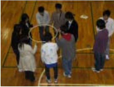
イニシアチブゲーム「UFO」 全員の協力がないと、成功しません。