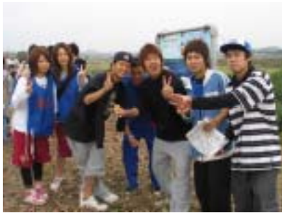
第1チェックポイント、まだまだ元気な福祉スポーツ科の1年生