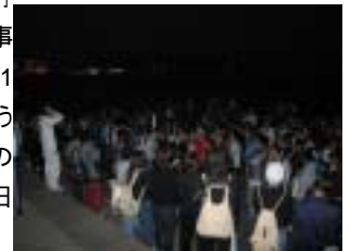
閉会式は真っ暗になった東浜海岸で

30Kmもの距離を歩く機会はなかなかありませんが、「大変」「疲れる」といった事だけでなく参加した1人1人が協力し合うこと、支えあうことの大切さを感じた一日でした。