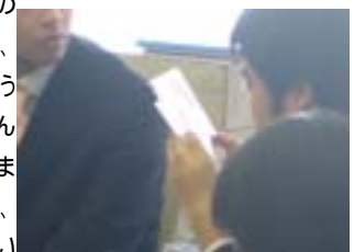
何枚もの絵を見せてくれました。