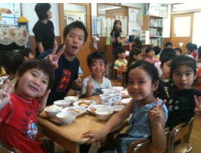
今日のおさかな、おいしいよー！