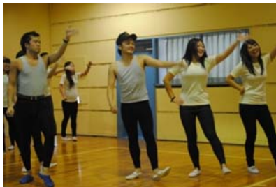
見事なパフォーマンス「昭和時代」