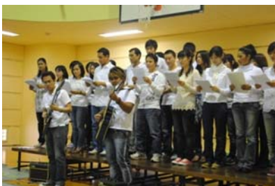
初参加の日本語学科はギター演奏も