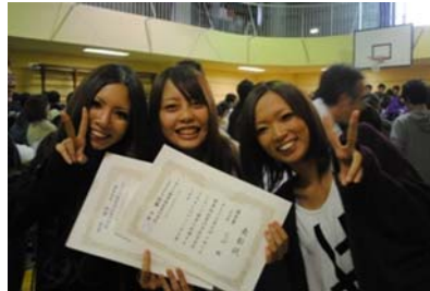
賞状もらいました!