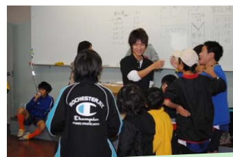
← 1 昨年の様子