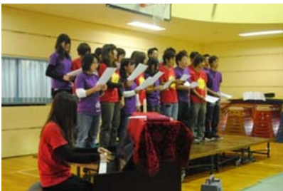
伴奏も一生懸命がんばりました