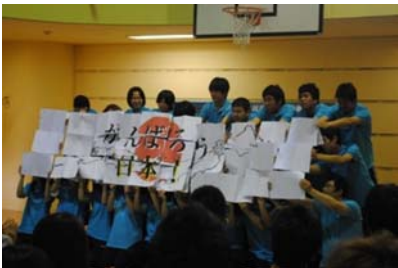
介護福祉科1年生は楽譜の裏面でメッセージ