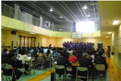
体育館が音楽ホール?へ変身!

今年は「歌と元気を被災地に届けよう」がテーマ。各クラスがそれぞれの思いを胸に課題曲、自由曲に取り組みました。