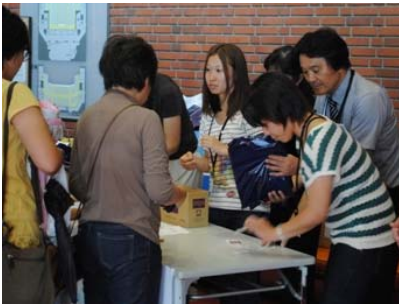
受付でのチケット受け渡し